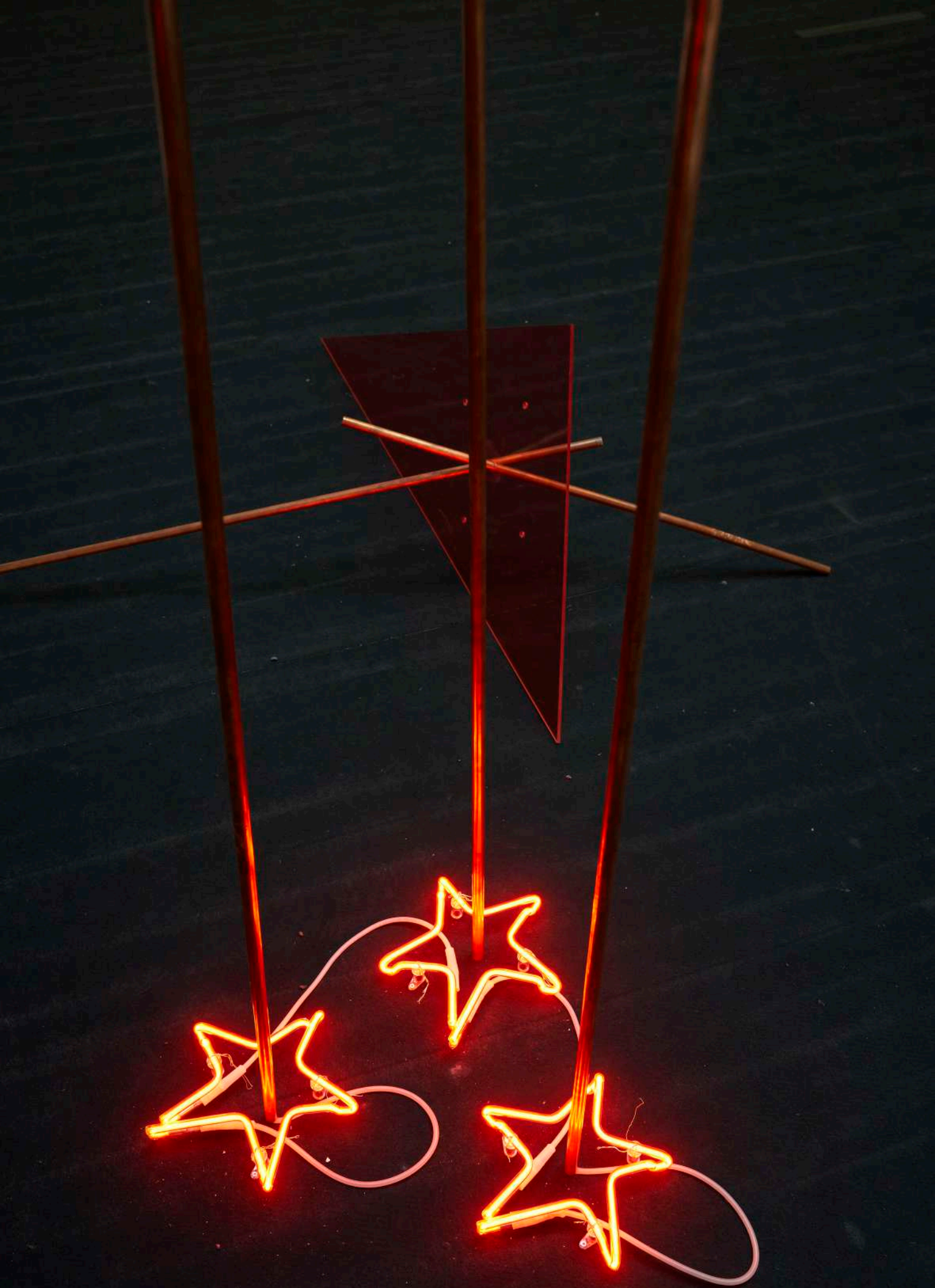
Détail "Burning sky" 2022 et "Hérisson commun" 2022, plexiglass , cuivre dimensions