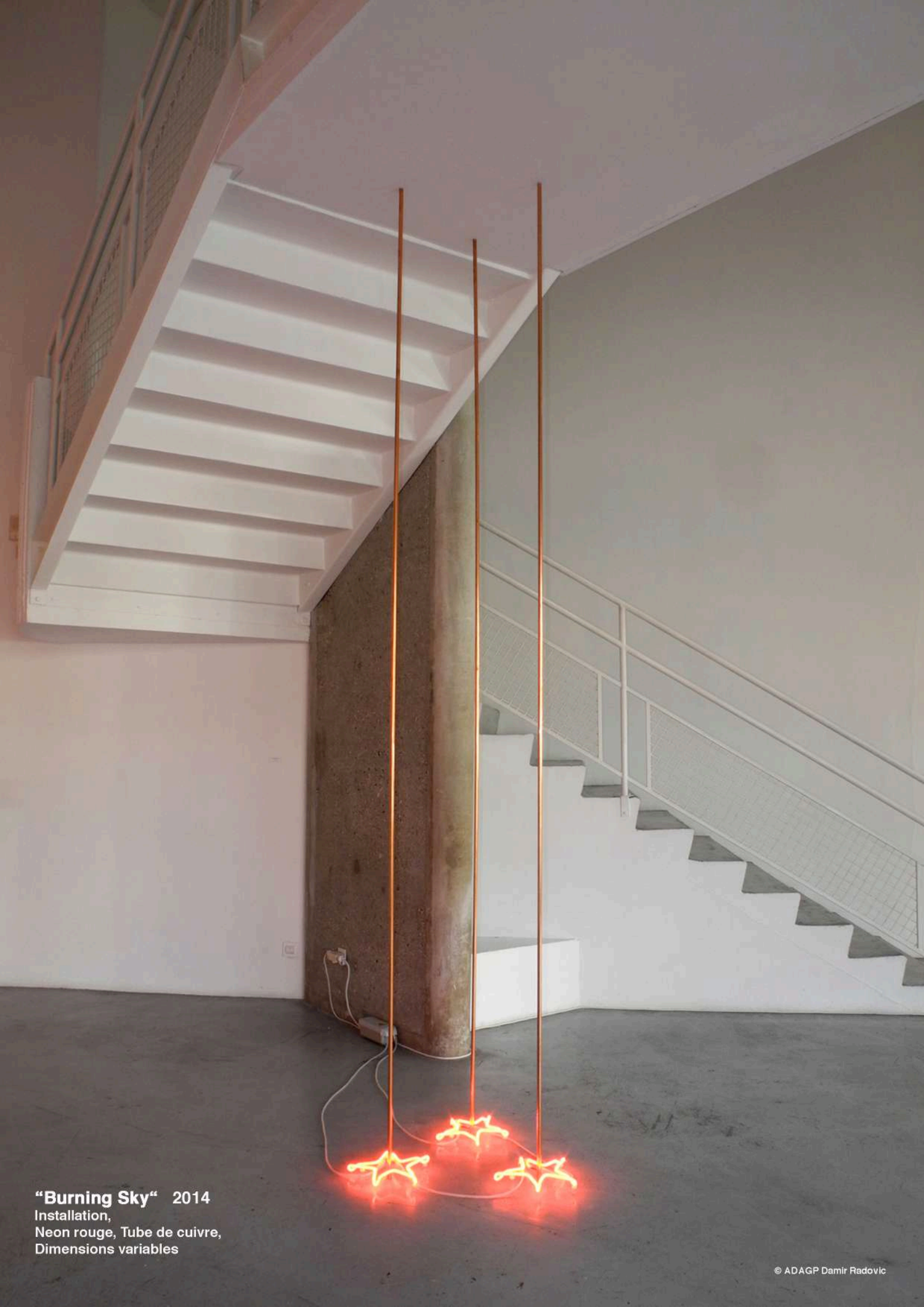
"Burning Sky" 2014 Installation, Neon rouge, Tube de cuivre, Dimensions variables