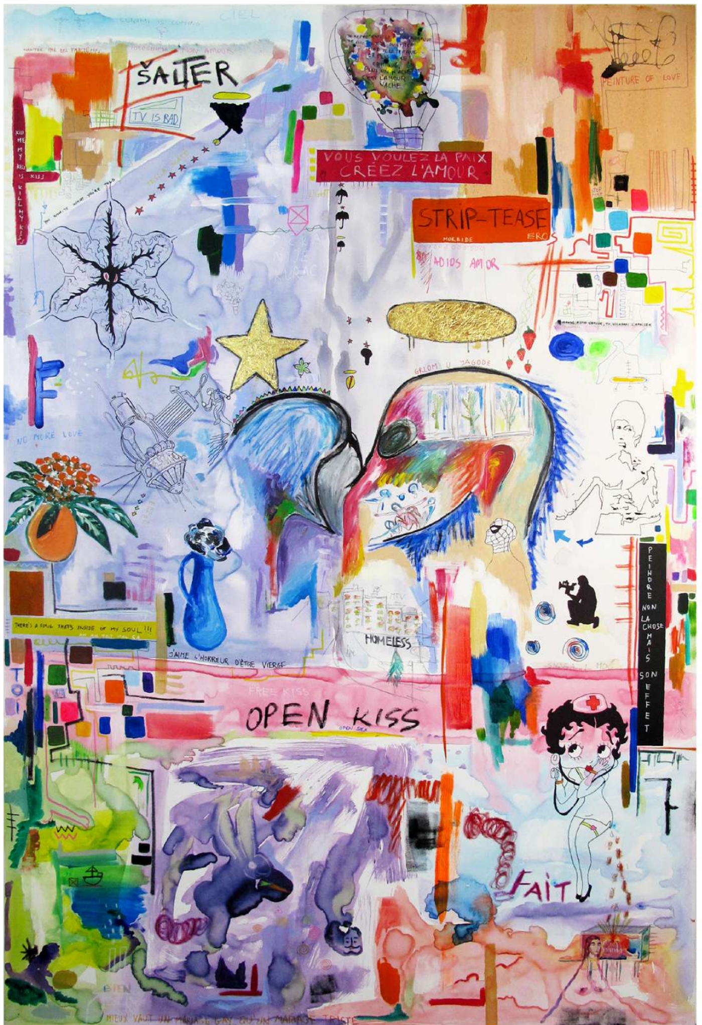
"Open kiss" 2024 200 cm x 300cm, Technique mixte sur toile