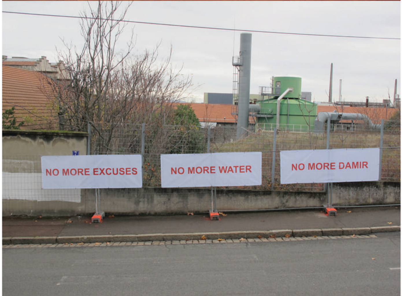
"The Blind Spot" 2014-2017