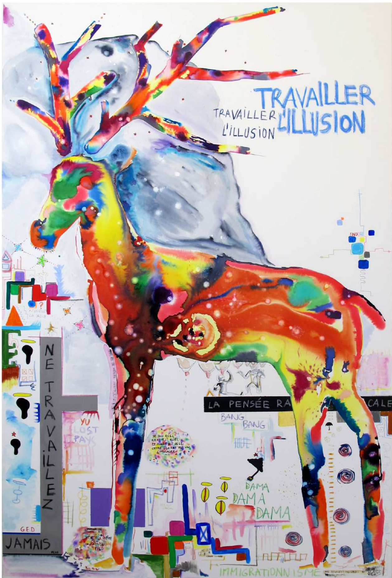
"Ne travaillez jamais" 2019

Aquarelle / Acrylique / Encre de Chine / Pastel à l'huile Water colors / Acrylic / Black ink / Oil pastel 210 cm x 140 cm