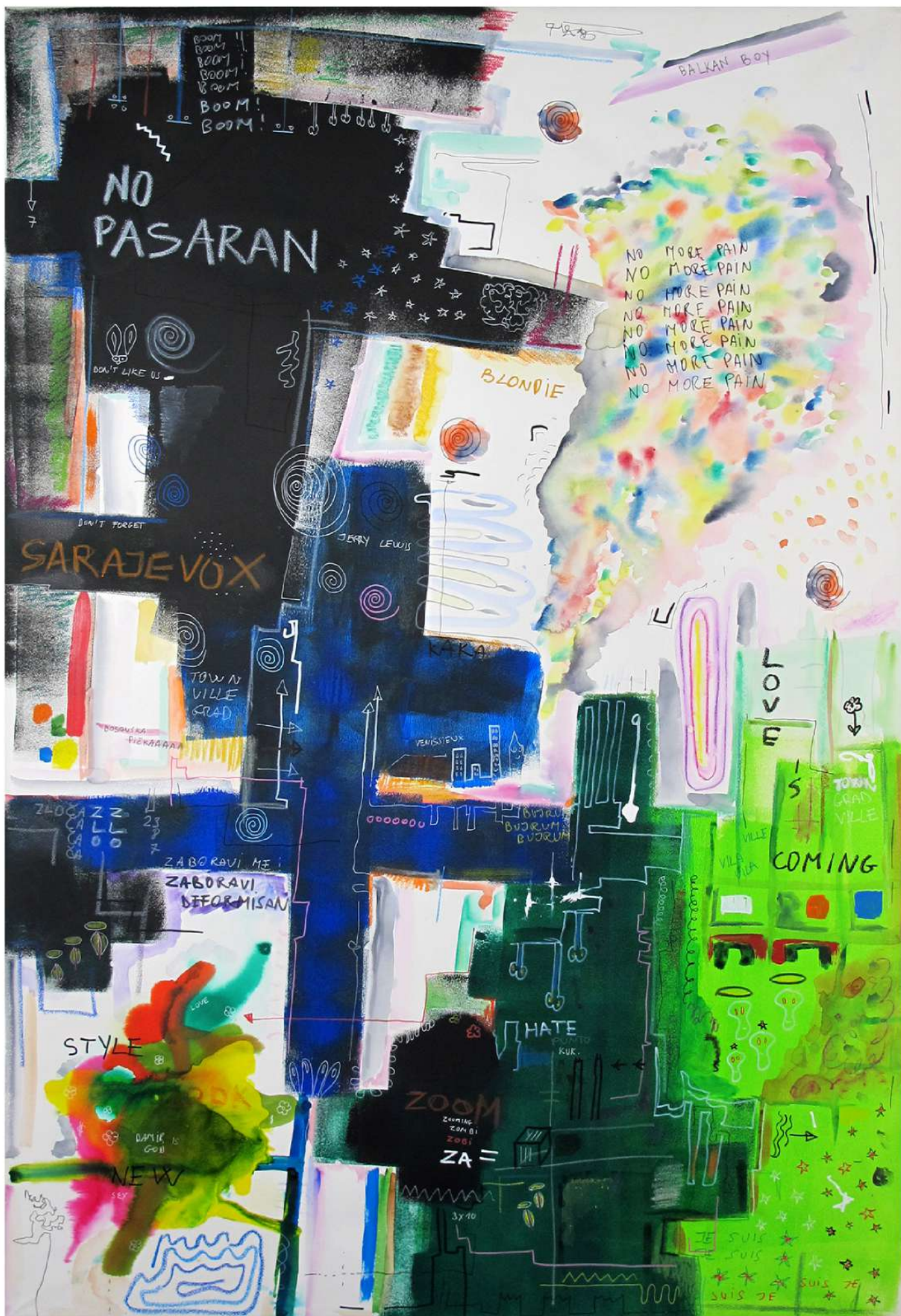
"No pasaran" 2021, 130 cm x 90 cm Technique mixte sur toile