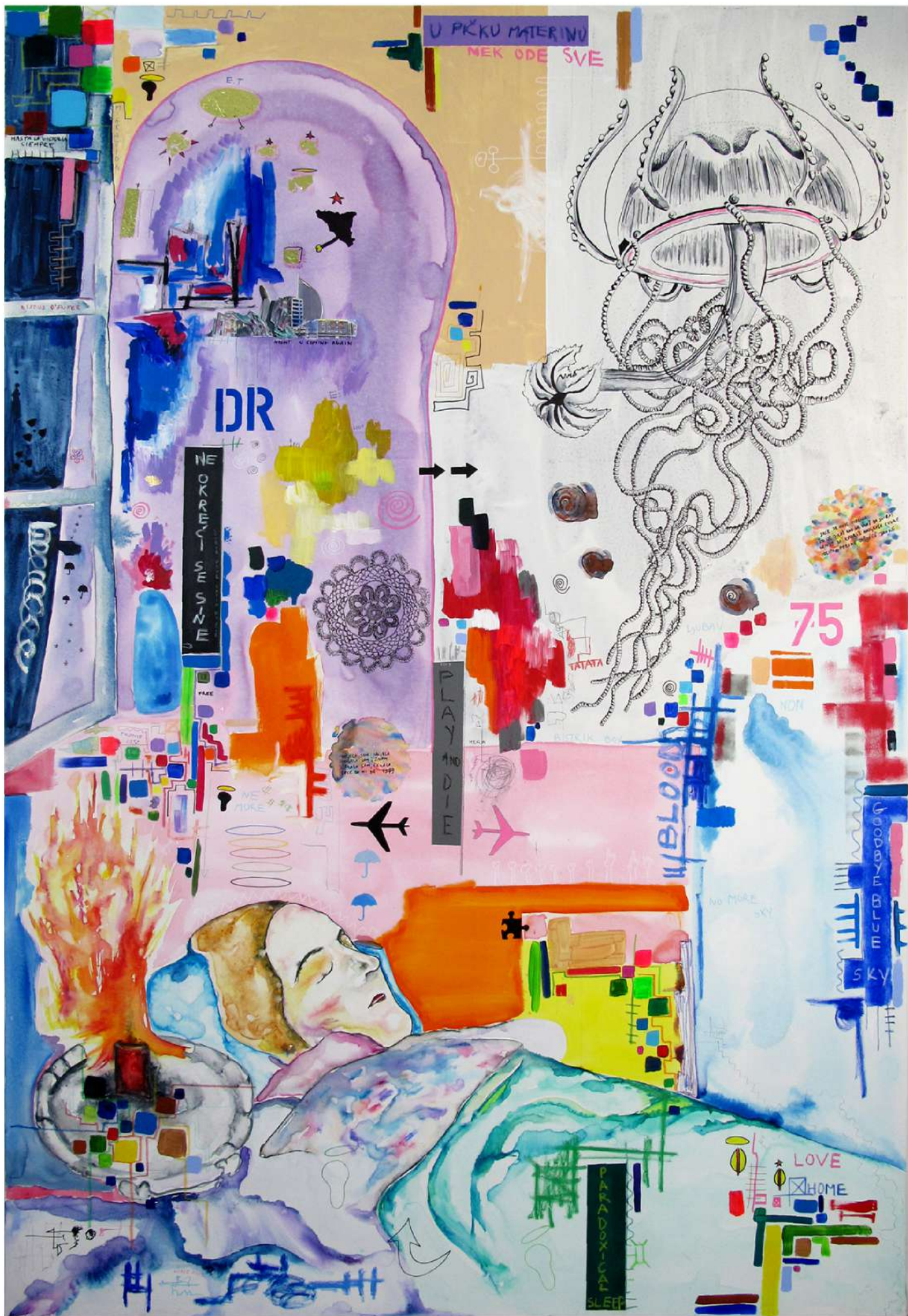
"Paradoxical sleep" 2024 200 cm x 300cm, Technique mixte sur toile